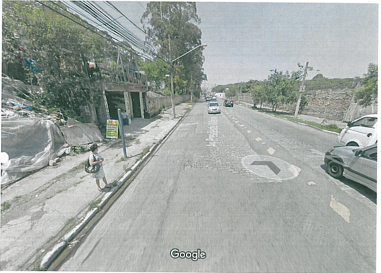
Captura da imagem: out 2015