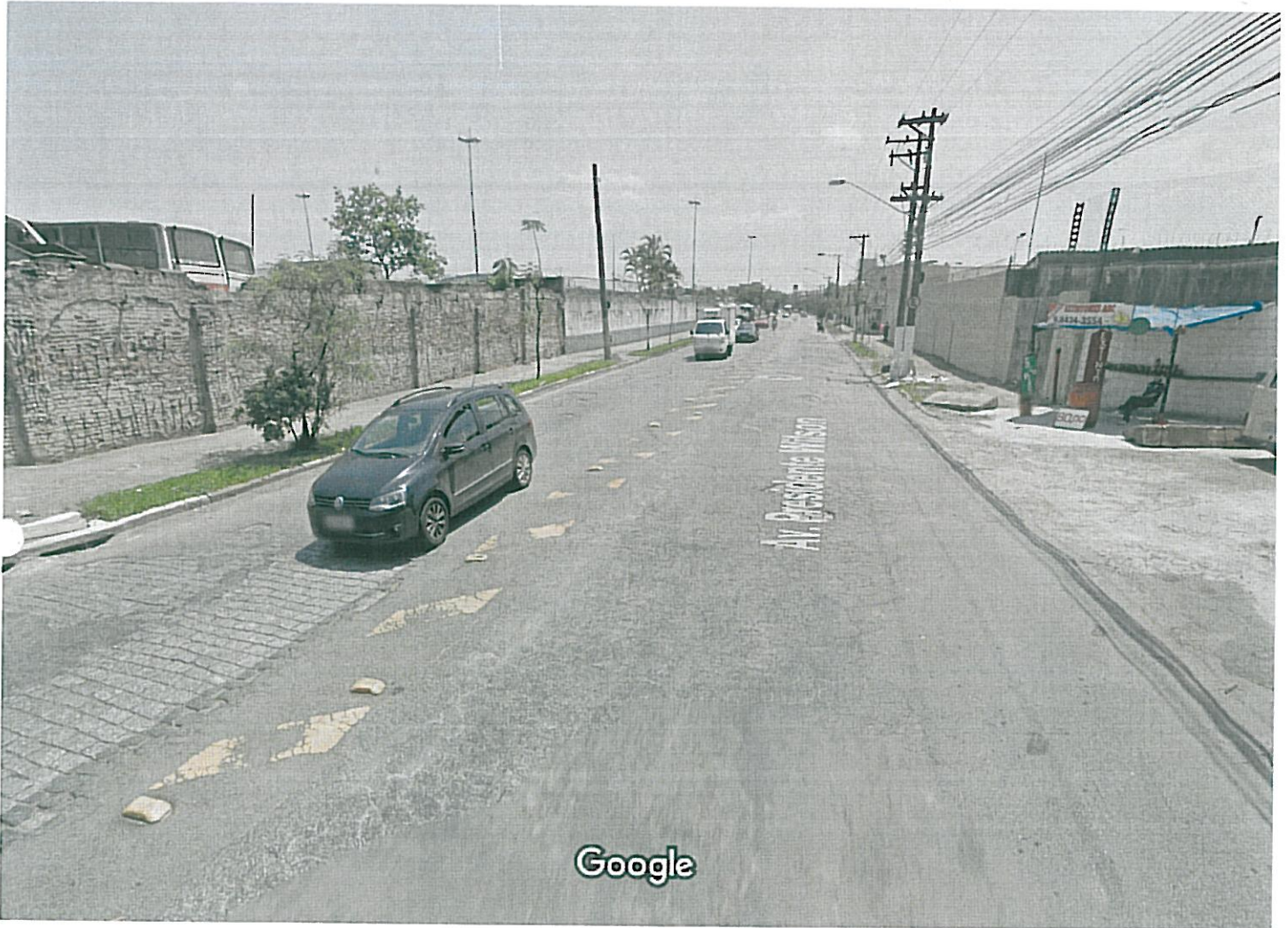
Captura da imagem: out 2015